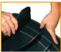
Art. Nr. 42260: Fächerunterteiler für VendorKing

Optional können für den VendorKing im Paket fünf praktische Fächerunterteiler bestellt werden. Diese sind einfach einzustecken und schaffen, je nach Anforderung, zwei bis sechs Kammern zur Unterbringung der Ware.